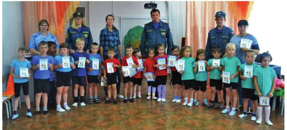
На снимках: противопожарные учения в детсадах; награды – достойным.