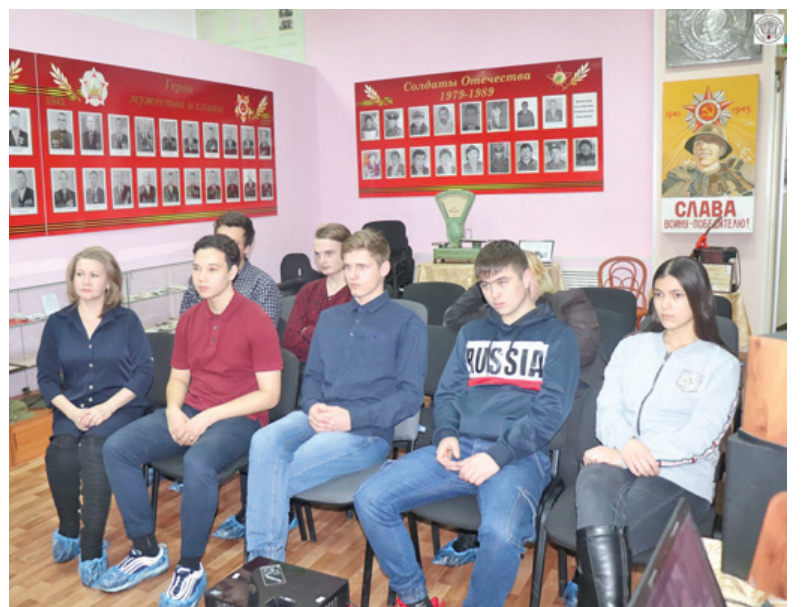
Студенты ТМТ на уроке мужества