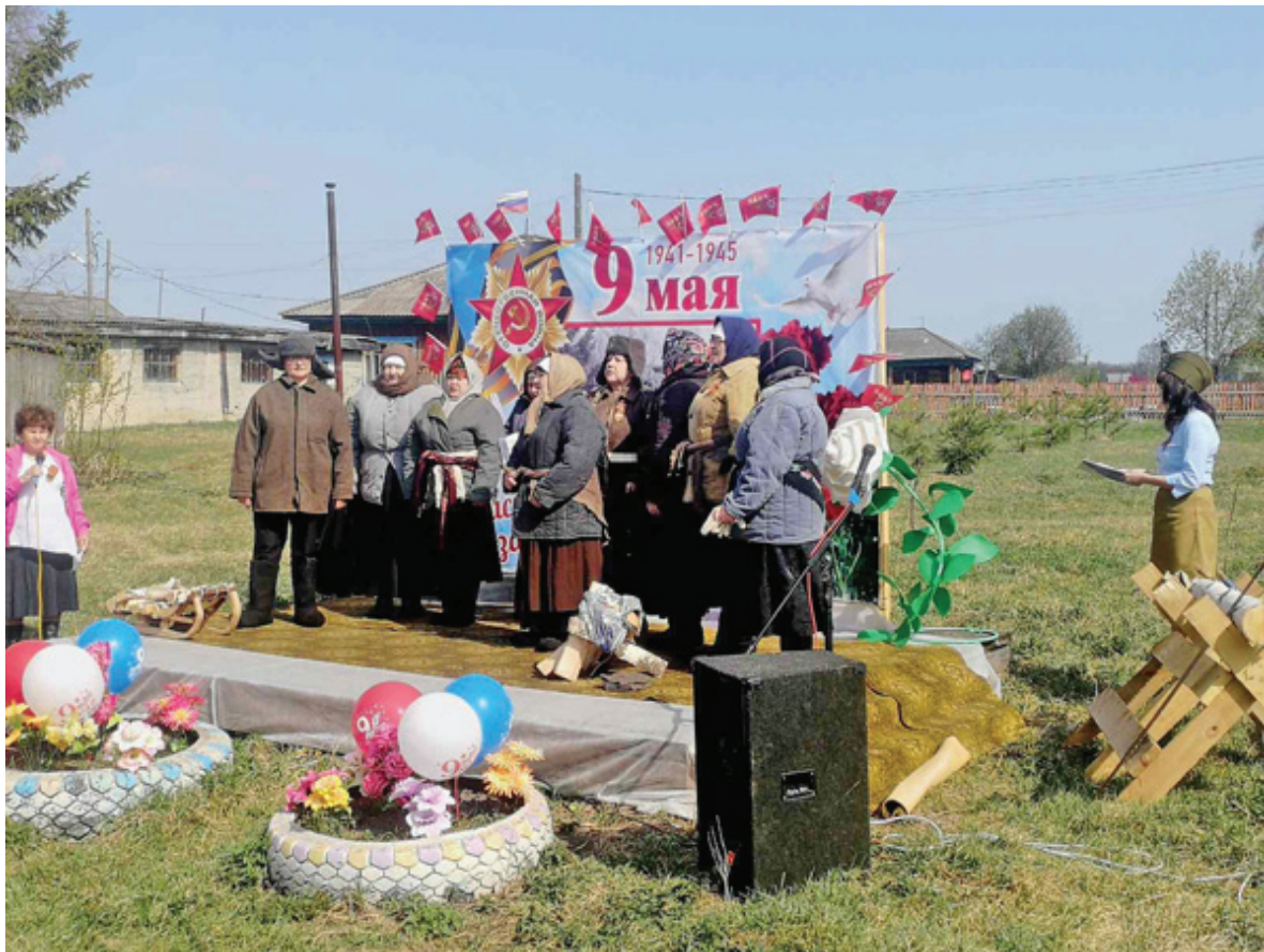
Супринцы празднуют День Победы