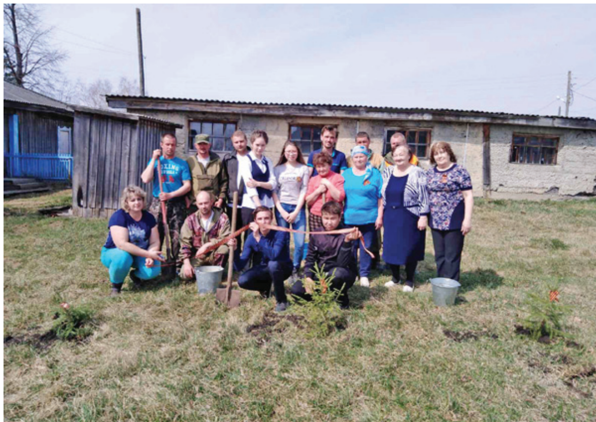
На уборке территории

нистрации есть свой «штаб», своя ветеранская комната. Гордостью супринцев-ветеранов является музей, расположенный здесь же. Экспонаты начали собирать с 2012 года, помогали все пенсионеры. Совет ветеранов вы-