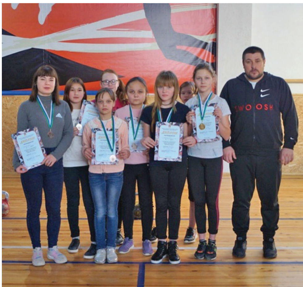
Победители и призеры чемпионата по гиревому спорту среди девочек