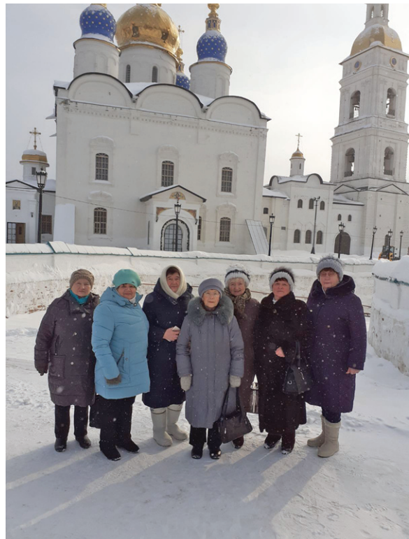
Зареченские пенсионеры на экскурсии

Спасибо всем, кто содержит этот восхитительный музейный ансамбль в идеальной чистоте и