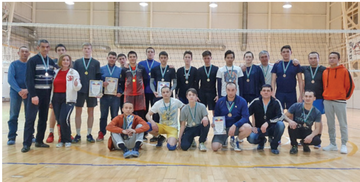
Участники турнира по волейболу