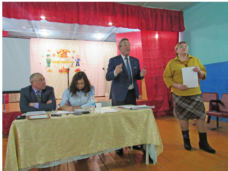
На сходе в с. Аксурка

Участковым специалистом по социальной работе совместно с другими службами проводилась