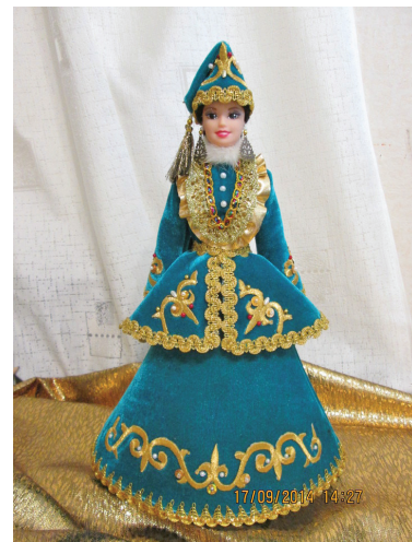
Кукла «Царица Сузге»