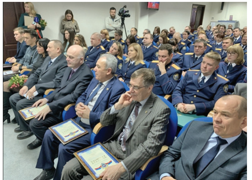
Участники торжественного мероприятия, посвященного годовщине образования СК РФ