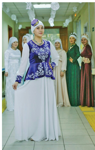
Сарауц – головной убор сибирских татар