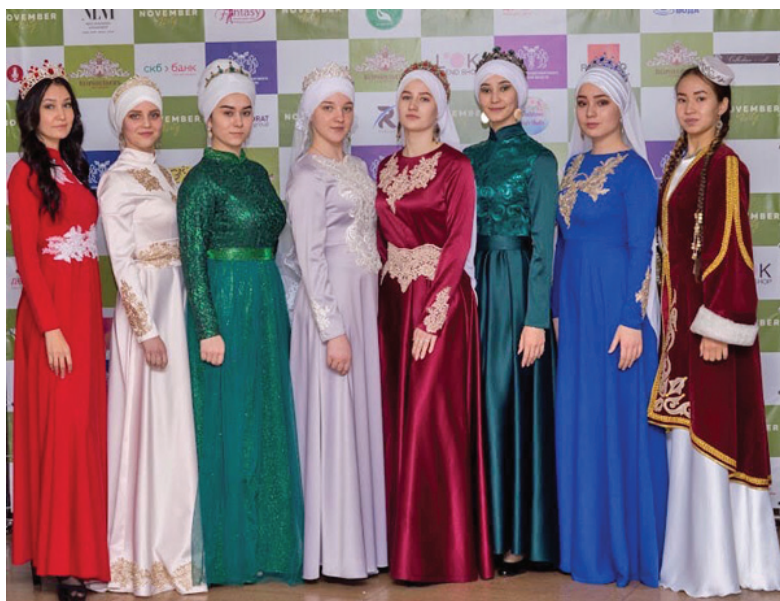
Тобольские красавицы в национальной одежде