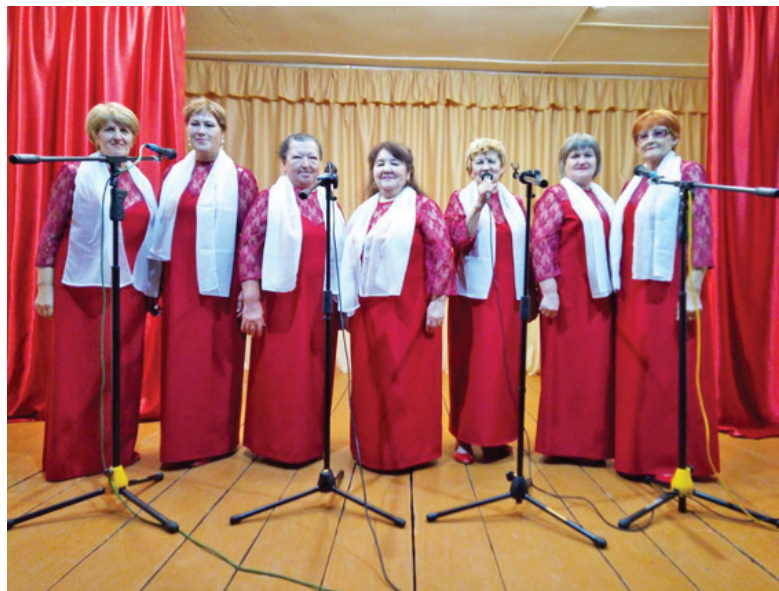
Ансамбль ветеранов «Вдохновение» (п. Иртыш)