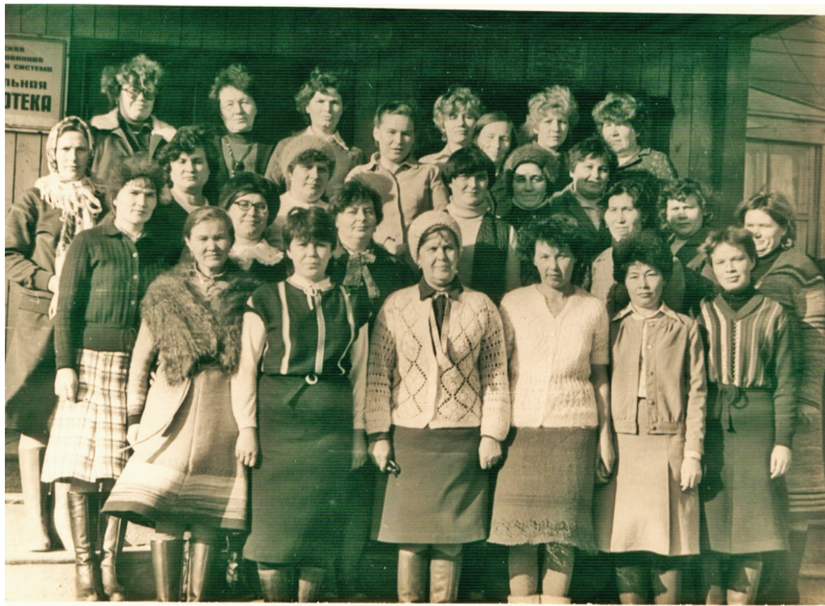
Работники Центральной библиотеки и филиалов. 1985 г.

Сотрудники Центральной библиотеки принимали активное участие в областных, районных фестивалях и конкурсах.