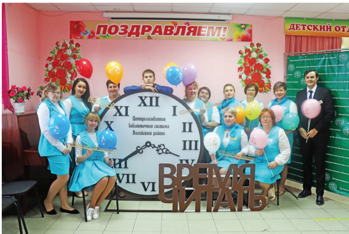
Коллектив Центральной библиотеки

Юбилей библиотеки – это всеобщий праздник, это праздник всего коллектива и тех, кто приходит в библиотеку за книгами, за советом, за общением. Книгу у нас любят, книгу ценят, ей воздают должную хвалу, а библиотека – храм книги. И невозможна она без хранителей этого храма – библиотекарей. Поэтому дружный коллектив Центральной библиотеки всегда радушно принимает своих читателей, ведь все они каждым своим приходом оставляют в ее стенах часть своей жизни, часть теплоты сердец.