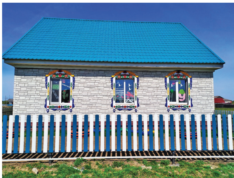
Новый дом Тимировых

получили с семьей Тимировых в один день. «Дом площадью 120 квадратных метров с мансардным этажом мы начали строить в 2017 году, задействовали в нем средства материнского семейного капитала, – рассказывает моя