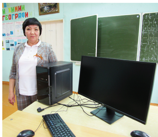
Компьютеры – в подарок Аксурской школе