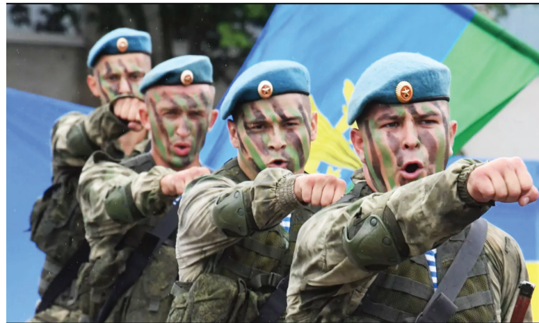
Военнослужащие 83-й бригады воздушно-десантных войск России выступают во время празднования Дня десантника во Владивостоке

Поскольку на медкомиссии учитывают показатель веса,