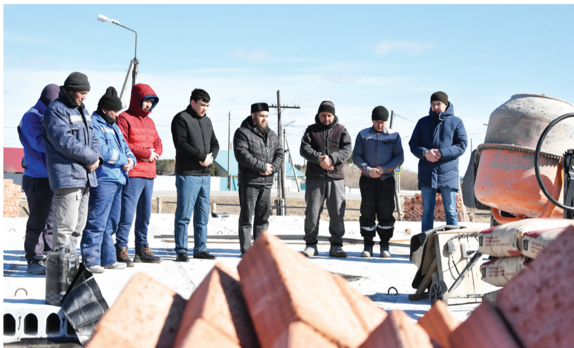
Молитвы о благословении на начало строительных работ

– Да, сейчас идет месяц Рамадан или Рамазан. Священный месяц, один из четырех священных. Пост ураза в месяц Рамазан является большим делом, ведь Аллах предписал верующим