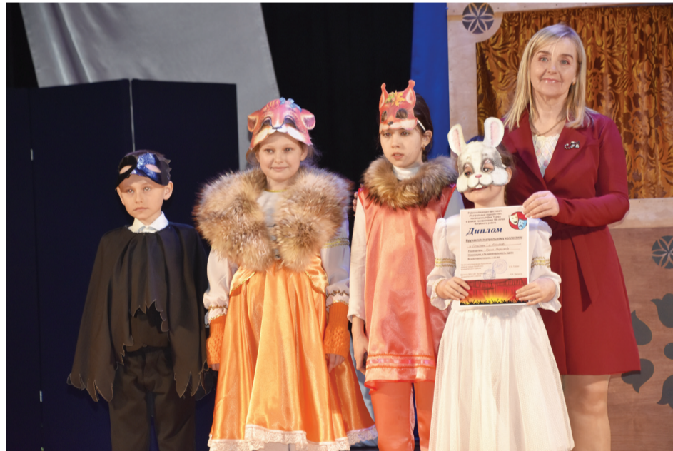
Театральный коллектив «Смайлики» – лауреат I степени

Первыми на сцену вышли маленькие актеры театрального коллектива «Зазеркалье» из Зареченской школы. Ребятам удалось весело и эмоционально показать сценку из произведения Сергея Михалкова «А что у вас?». Бурными аплодисментами ребят провожали со сцены и встречали новых артистов. В ходе всех выступлений коллективам удалось проде-